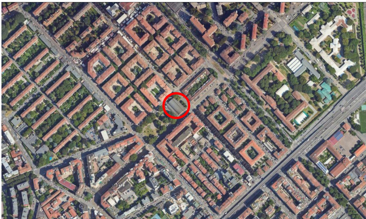
Figura 1. Immagine satellitare con indicazione dell'area di insediamento

È stata quindi verificata la compatibilità dei livelli con i limiti di immissione sui Recettori sensibili, definiti in base alla classificazione acustica del territorio comunale effettuata ai sensi della L. 447/95 e della Legge Regionale n. 13 del 10 agosto 2001.