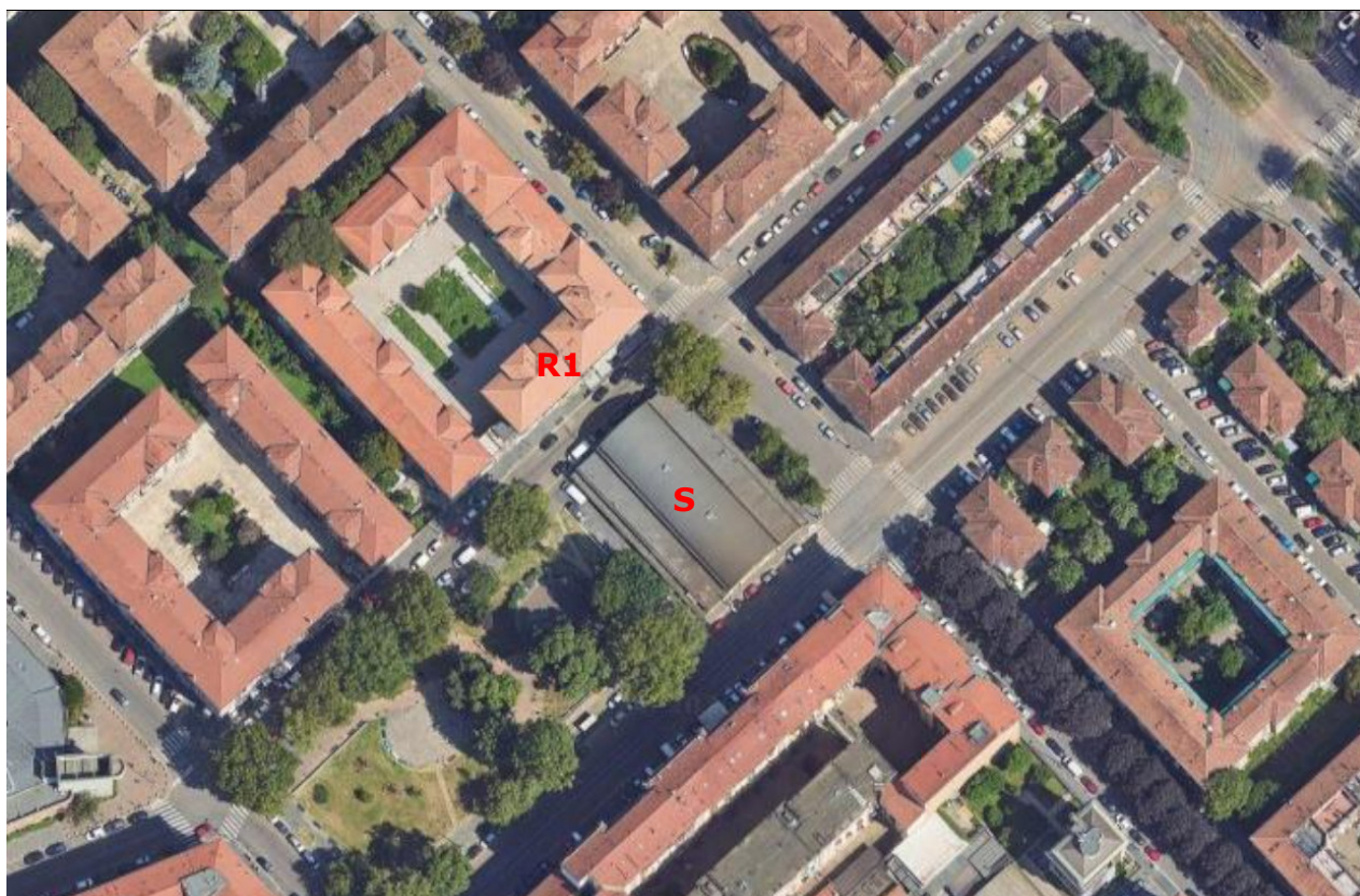
Figura 3. Immagine con indicazione del fabbricato oggetto d'intervento e del Recettore sensibile

Tali Recettori sono posti in zona di Classe III (Aree di tipo misto); a favore di sicurezza sarà verificato il rispetto dei limiti in considerazione della Classe più bassa.